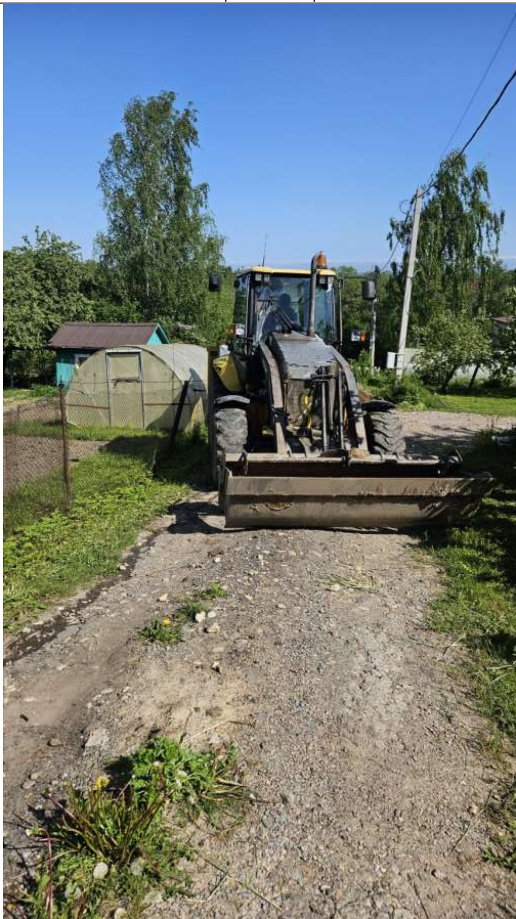
Начало производства работ