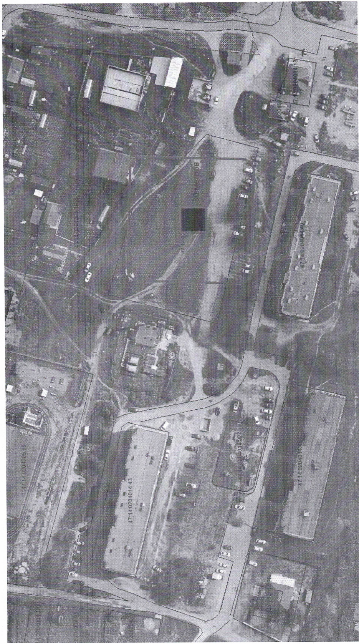
Схема технических решений применения пиротехнических изделий

■ Место определенное для пуска пиротехнических изделий