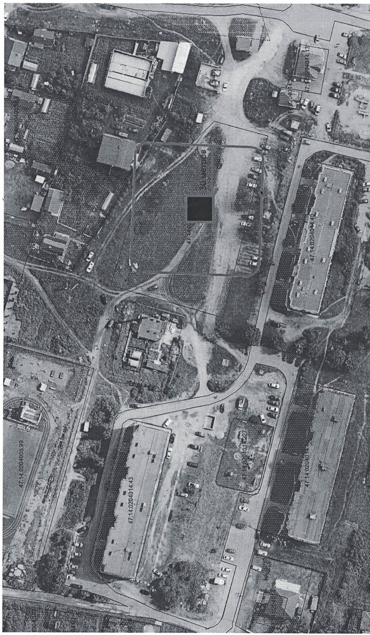
Схема технических решений применения пиротехнических изделий

■ Место определенное для пуска пиротехнических изделий