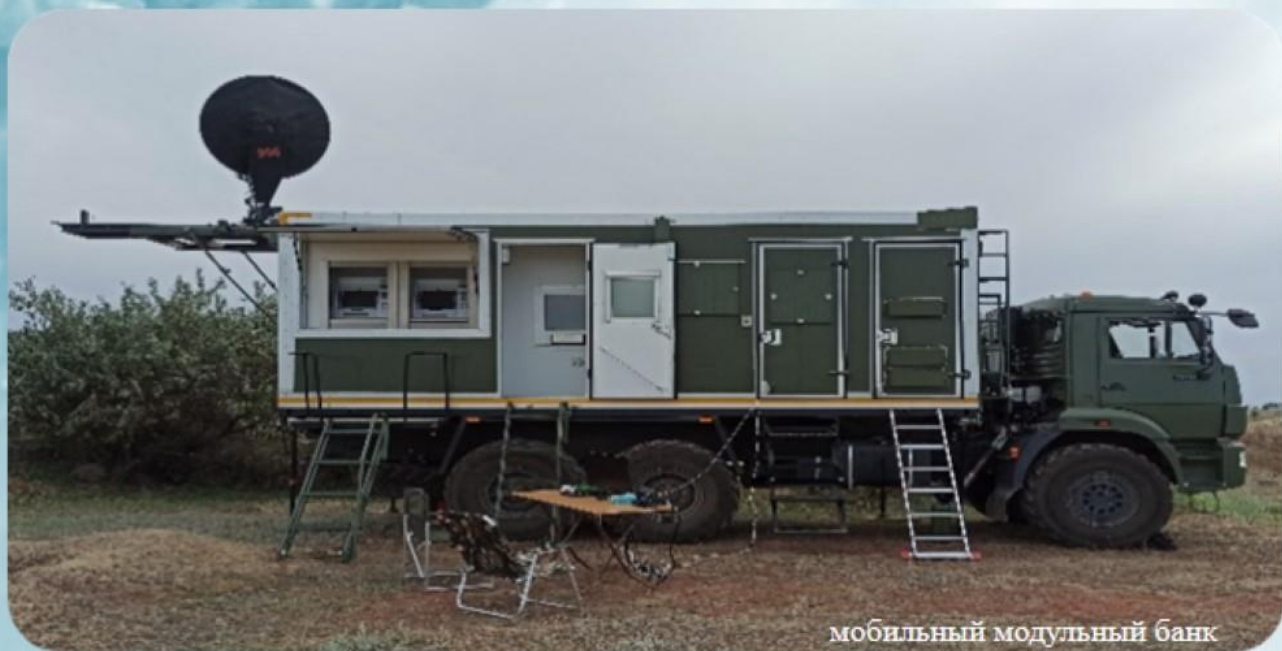
мобильный модульный банк